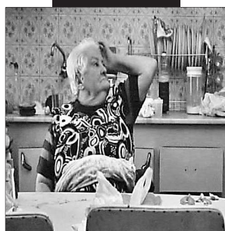
Fotogramas del cortometraje "Quitaesmalte"