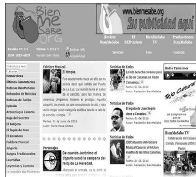
Portada de la revista digital "BienMeSabe.org"

Estos galardones serán entregados en el transcurso de un acto que tendrá lugar en el Salón Noble del Cabildo de Tenerife el viernes 17 de diciembre